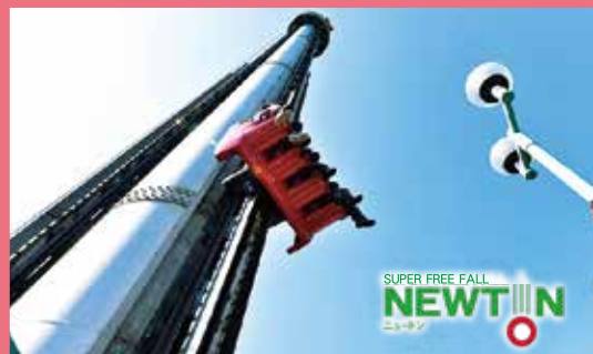
SUPER FREE FALL NEWTON