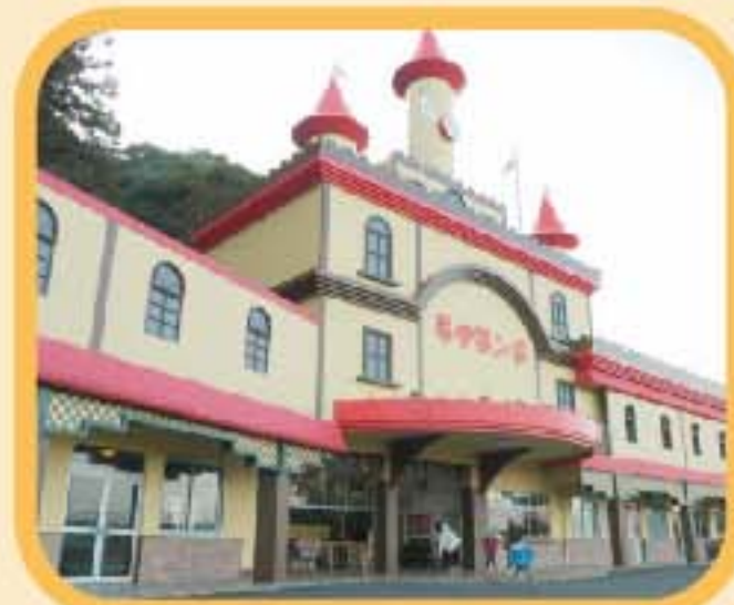
別府ラクテンチ レトロロードあふれる遊園地。