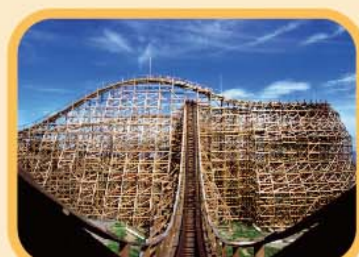
城島高原パーク 木製コースター『ジュピター』など 人気のアトラクションが楽しめる 森の中の遊園地。