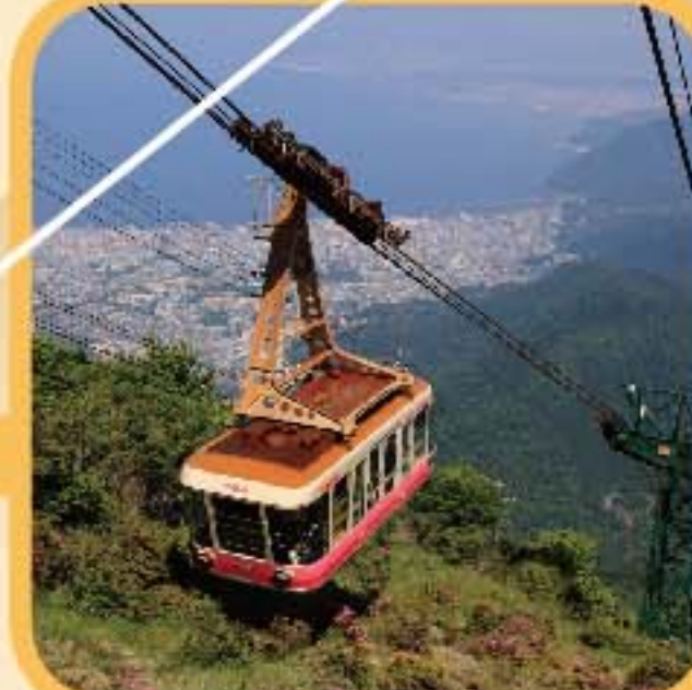
別府ロープウェイ 標高1375mの鶴見岳山まで わずか10分でのぼります。