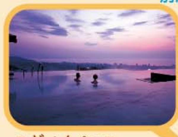
スギノイパレス 大展望露天風呂「棚湯」。