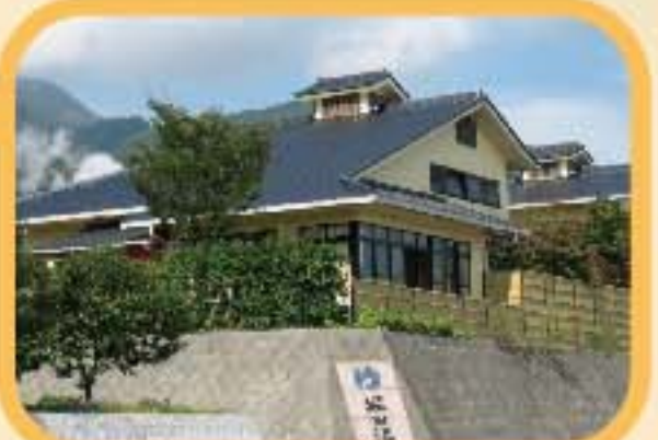
堀田温泉 利用者の多い 人気の市営温泉。