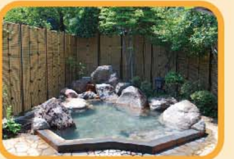
柴石温泉 緑に囲まれた温泉場。 近くに森林遊歩道も あり。