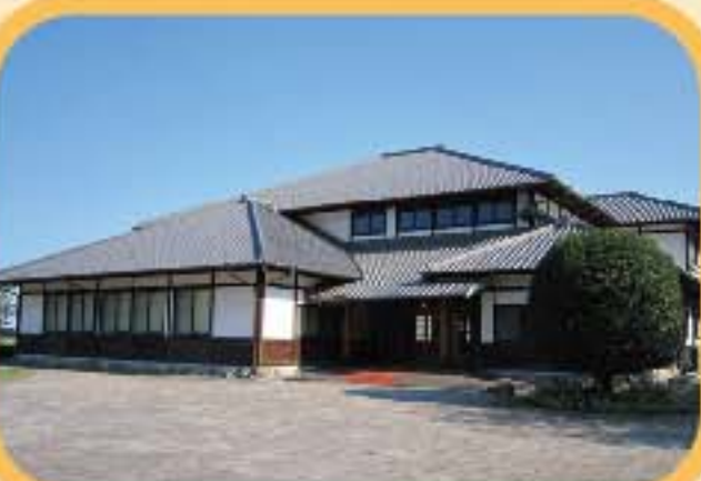
竹細工伝統産業会館 別府の伝統竹工芸を堪能しま しょう。人間国宝の作品も有。