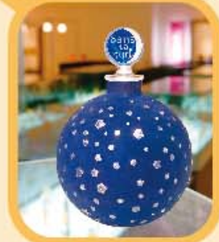
●大分香りの博物館