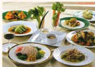
自然食スローフードバイキング