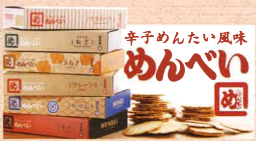
人気のおみやげ・めんべい