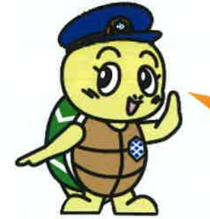
亀の井バス PR部長 かめたん

バスガイドが初めて日帰りツアーを企画いたしました。 みなさまのお申し込みをお待ちしております!