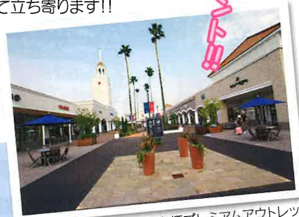
鳥栖プレミアムアウトレット

★古賀工業団地で約2時間のショッピングをお楽しみ下さい。オリジナルマップを配布いたします。 ※大きめのエコバックや保冷バックを用意することをオススメいたします。