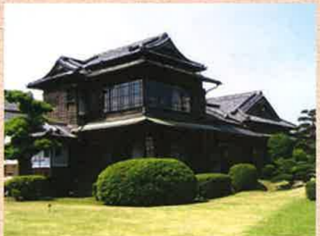
~旧伊藤伝右衛門邸~