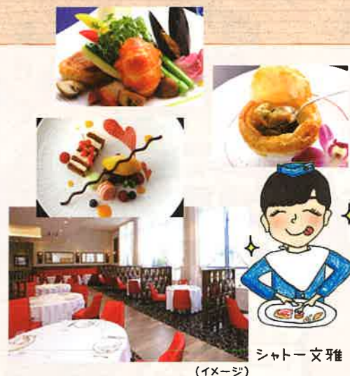
シャトー文雅 (イメージ)