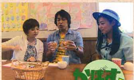
6月11日(土)放送の OBSテレビ9:25~ 「かぼすタイム」にて紹介されました